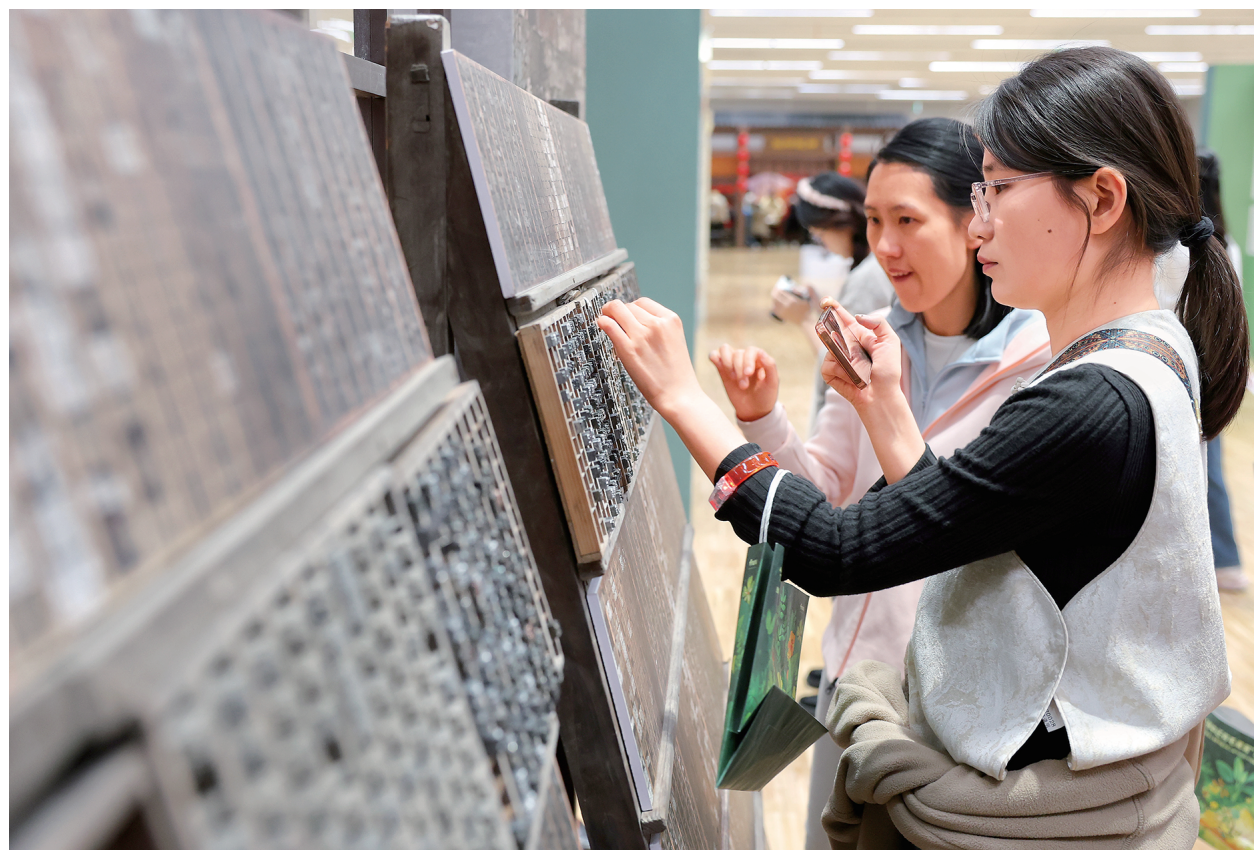
读者在“上图之夜”体验活字印刷术。

“笔·迹!书写的轨迹”板块关注的是全球书写工具与文字形态的交互演进,阐述人类历史如何被书写和记录,除了上图发布的系列活动、上海书展系列活动,还有“无声的表达者:创意字体”主题文展、“阅读脱口秀”活动、纪念陀氏诞辰205周年主题文展、纪念老舍逝世60周年主题文展等活动。围绕“色彩”和“图像”,“色·象!视觉的叙事”板块探索书写表达中的叙事力量,重点活动包括年度大展——上海图书馆藏古籍木刻版画展,正在展出的《诗经》草木意象主