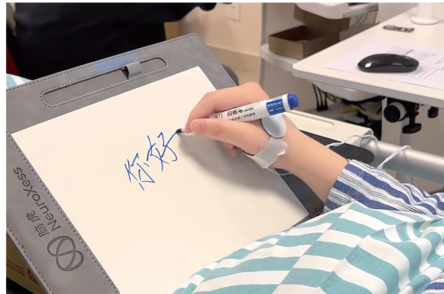
借助脑机接口驱动的功能性电刺激技术,患者自主握笔写字。