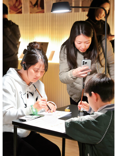
读者体验抄写描金。