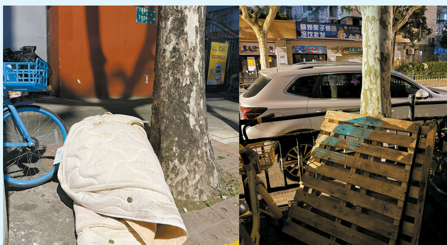
记者夜间沿街走访,在多条路的路边看到被随意丢弃的大件垃圾。

即日起,本报“民声”版开设“关注城市服务细节”栏目。我们将紧盯城市服务的不同领域,聚焦群众急难愁盼,反映一线呼声建议,推动各方进一步擦亮“上海服务”这张城市金名片。