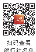
扫码查看旅行社名单

本报讯(记者 李宝花)上海市文化和旅游局昨天发布公告,即日起,上海居民可通过上海市、福建省具备相关资质的旅行社报名赴金门、马祖团队游和个人游,并按规定