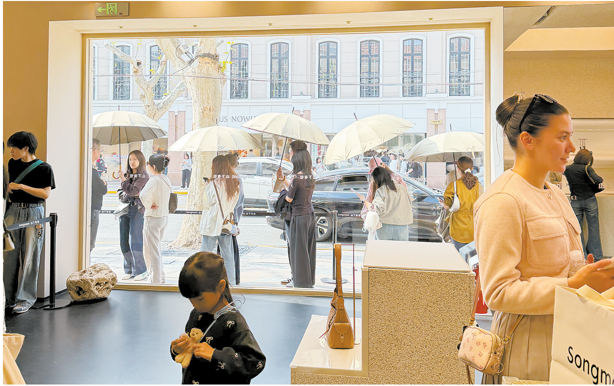
“山下有松”上海首店常年排队。

另悉,淮海集团今年将推动自有物业与历史建筑修缮更新,实施索尼旗舰店、新歌舞厅外立面焕新,古今、Helly Hansen、MASONPRINCE等外立面灯光及阳台绿化升级,并结合主题营销季联动沿线品牌打造特色橱窗,将商业街景融入城市公共空间。