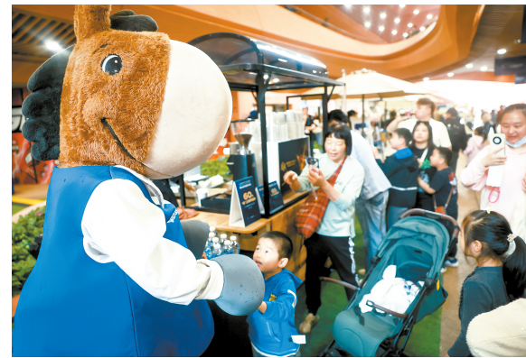
上海环球马术冠军赛打造丰富多元的场外体验。

没想到场外这么热闹,这趟来得太值了!”市民王女士笑着说。另一位专程从外地赶来的观众也感慨:“不仅能看顶级赛事,场外还有这么多有意思的活动,不用进场也能感受到满满的马术氛围,既热闹又有意义。”专属打造的“马年映像·骑趣花园”主题互动区人气爆棚,成为亲子家庭的打卡首选,孩子们在趣味体验中了解马文化、感受马术乐趣,大人们则在互动中放松心情、共享假日美好时光。