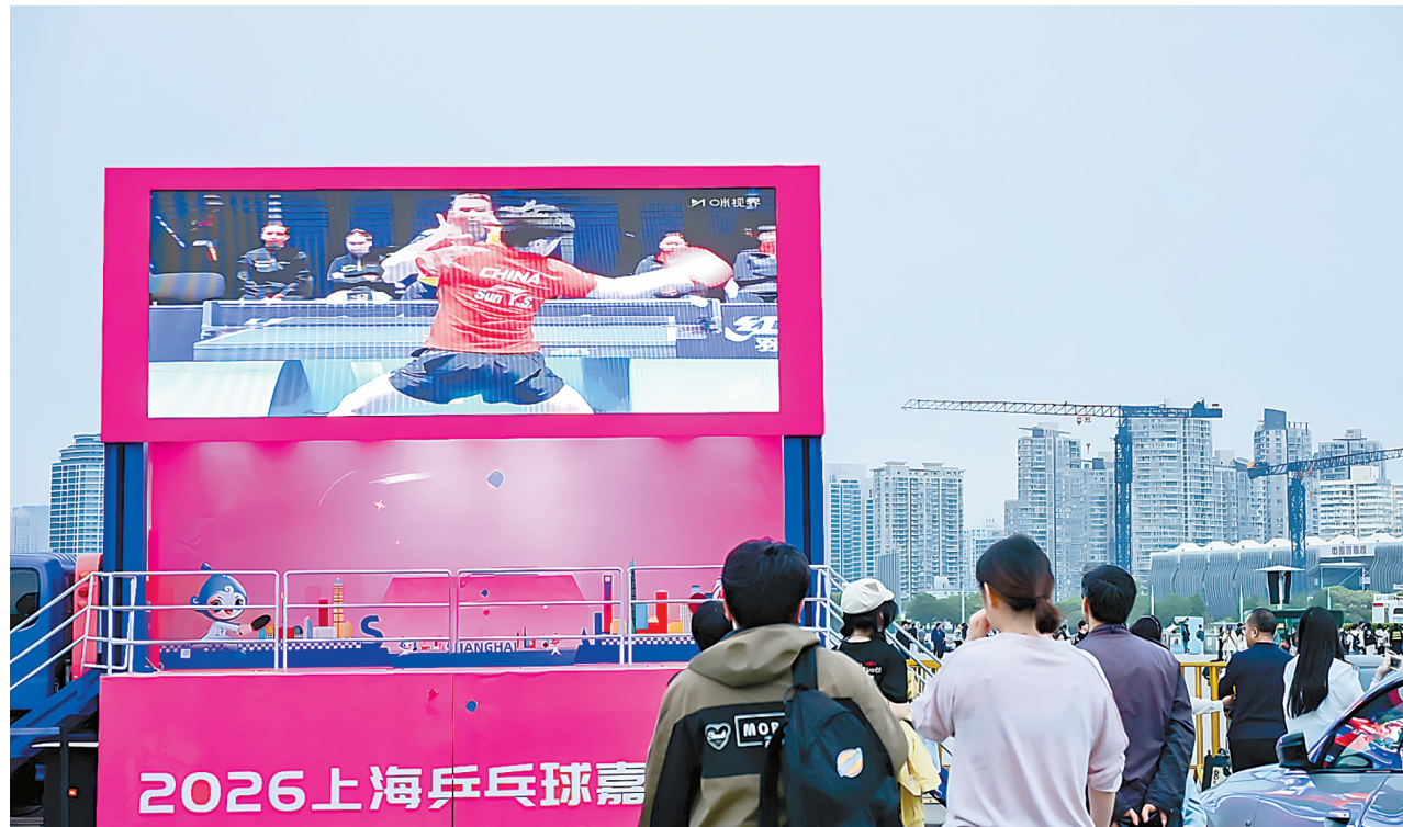
伦敦世乒赛团体赛种子队排位赛昨日开始,市民游客在大屏幕前观看中国女队比赛。