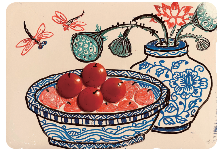
赵丽宏 绘 书中插图

语言风格方面，《为母亲作画》简约而意蕴悠长。赵丽宏的文字，向来以清新质朴、温润典雅著称，这一特点在书中体现得淋漓尽致，全文语言如同与读者促膝长谈，温润暖心。即便描写细腻的画面与情感，也只用了简洁的文字勾勒：写水泡眼金鱼，寥寥数笔便点出鱼儿的灵动；写母亲的神情只用“微笑”“凝视”“指尖颤抖”等词，便将母亲的内