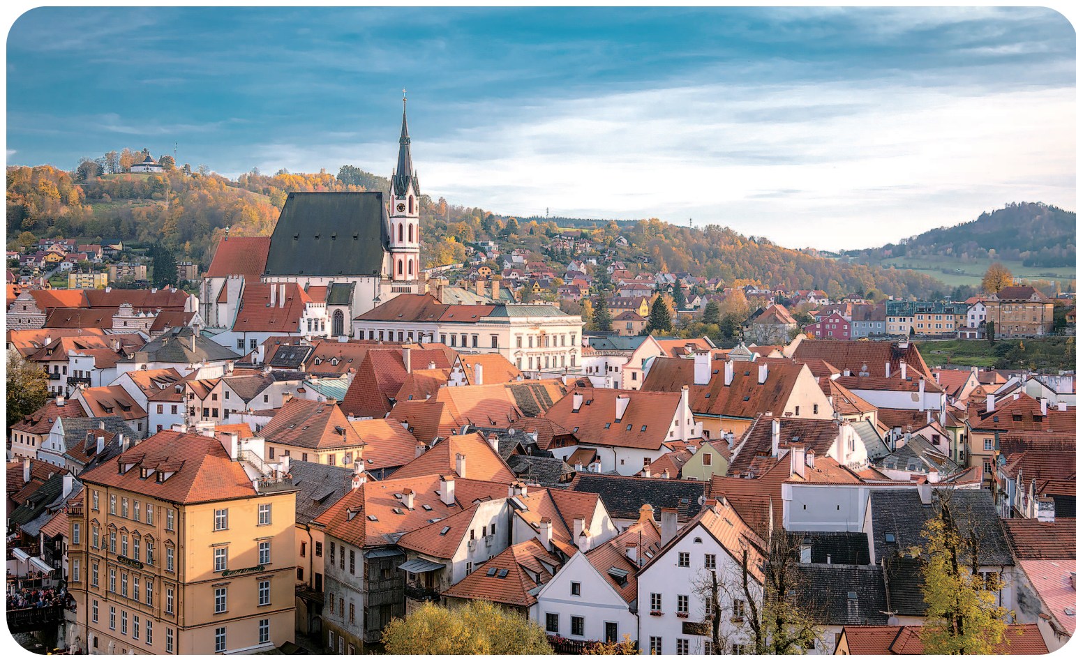
多重力量的动态制衡与迭代演变，最终勾勒出中国现代欧洲清晰的社会面貌与治理形态。