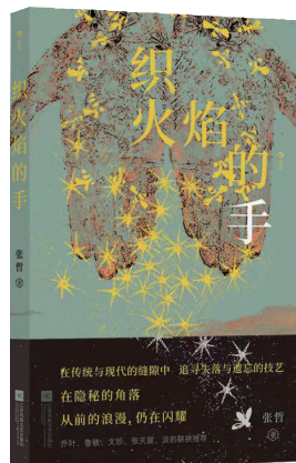
《织火焰的手》张哲 著 江苏凤凰文艺出版社