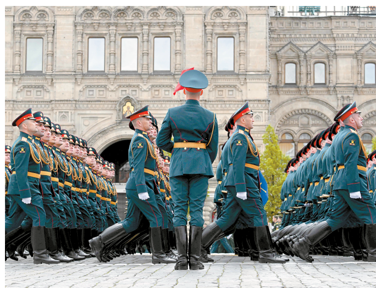
上图：军人参加纪念卫国战争胜利81周年阅兵式。右图：飞行表演队飞越红场上空。