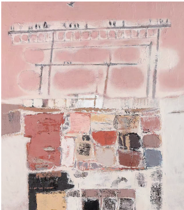
千里同风（油画）任杰

大概是某种巧合，手机推来舒婷的旧文《我儿子一家》，写于1988年。算了算，我爸那时刚刚大学毕业，还没结婚。读的时候，我忍不住在里面寻找“陈思”。原来，奶奶否定了父亲翻词典找来的字，最后定了“思”——为了怀