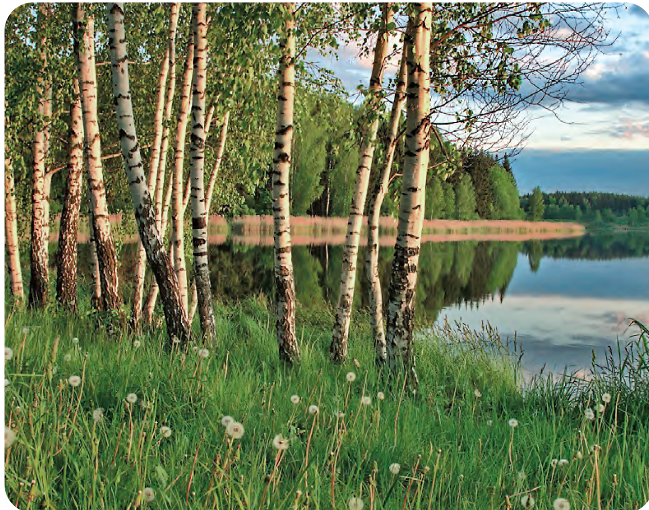
艺术所守护的，正是技术无法替代的精神温度与人文深度。 书中插图

要回答这些问题，不妨回到俄罗斯艺术传统。在那里，我们会看到一种截然不同的理解路径——艺术从来不仅仅是审美对象，更是一种具有深刻存在论意义的精神实践。它所关涉的，