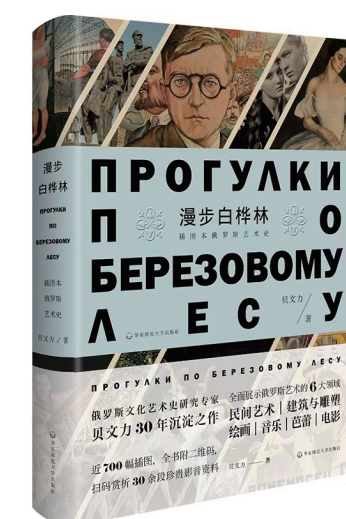
《漫步白桦林：插图本俄罗斯艺术史》 贝文力著 华东师范大学出版社

在人工智能不断改写知识边界的今天，重新翻开一部厚重的艺术史著作，看似“缓慢”，却恰恰是一种必要的精神坚持。《漫步白桦林：插图本俄罗斯艺术史》所提供的，正是这样一种穿越时代的阅读力量。它让我们在俄罗斯艺术的光影流转中，重新理解历史、民族与人的精神世界，也重新理解我们今天为何仍然需要艺术。在算法时代，坚持艺术史阅读，不是对过去的回望，而是对未来文明方向的人文守护。（作者系华东师范大学俄语系副教授）