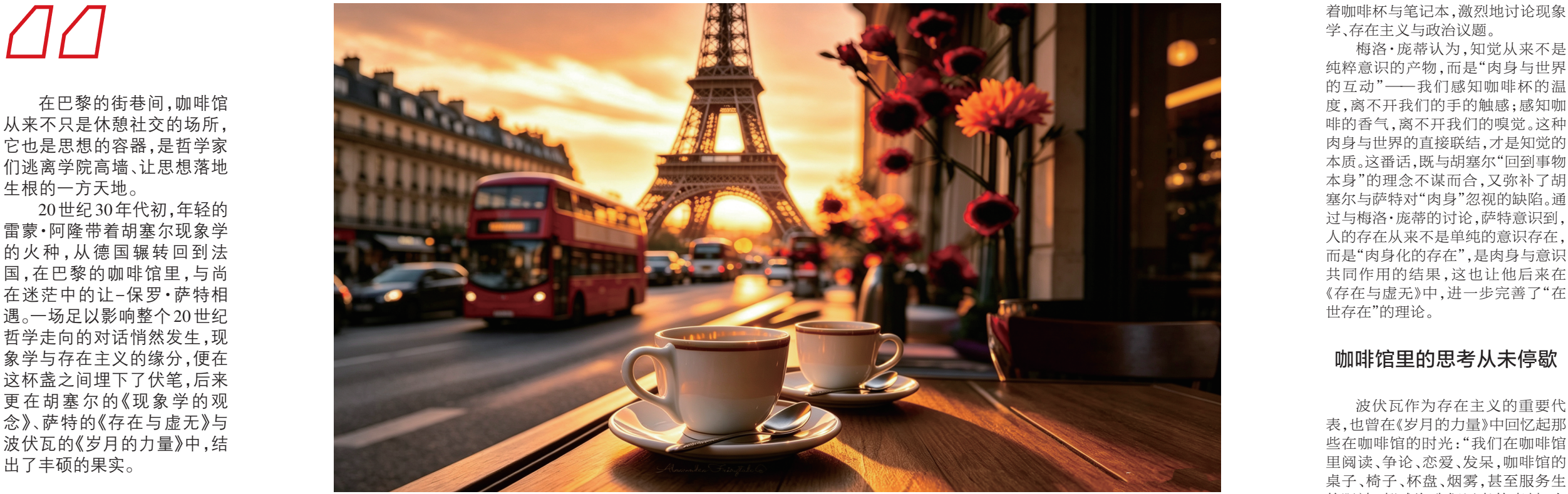
现象学的火种，早已在杯盏间传递，成为人类思想宝库中的重要财富。