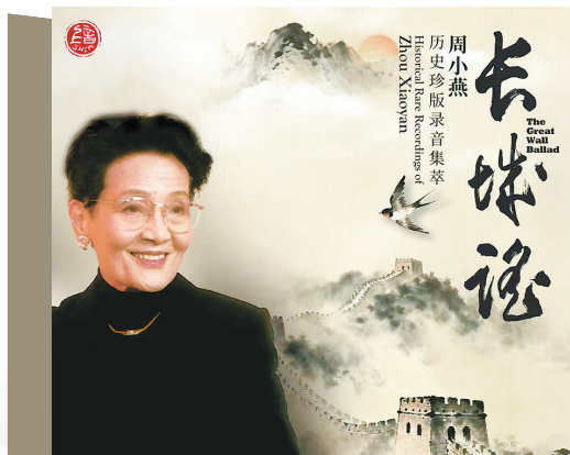
■《长城谣：周小燕历史珍版录音集萃》封面

在声音修复过程中，工程师坚持“最小干预”原则，保留了老唱片的温暖质感。正如周小燕所言“我的声音属于民族，属于时代”，这张专辑既是她艺术生涯的缩影，更是研究20世纪中国声乐发展的重要史料。据悉，活动由上海音乐学院与华中师范大学主办，还包括艺术歌曲丛书发布、学术研讨会及廖昌永大师课等。