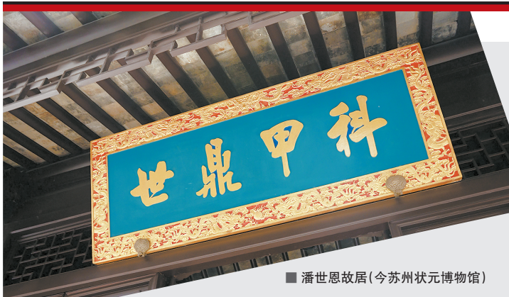
■ 潘世恩故居(今苏州状元博物馆)