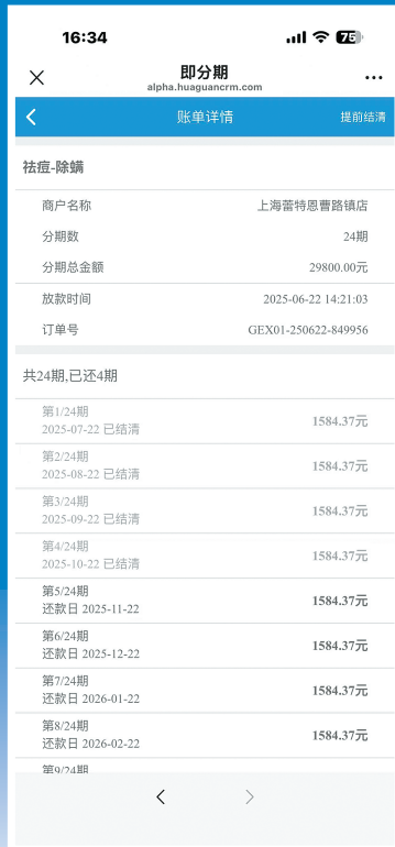
■ “即分期”贷款每期明细