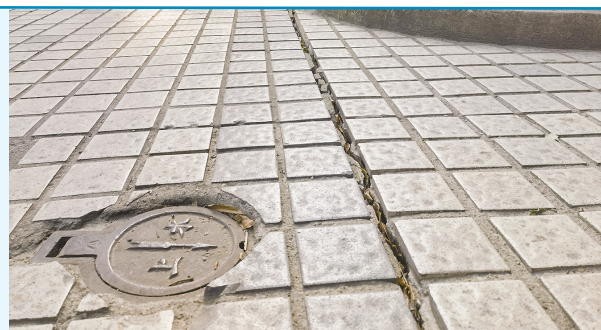
四号楼外地面裂开