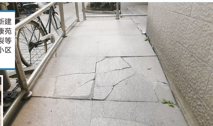
▲ 4号楼无障碍坡道路面碎裂 ▲ 4号楼门厅外台阶与地面脱开