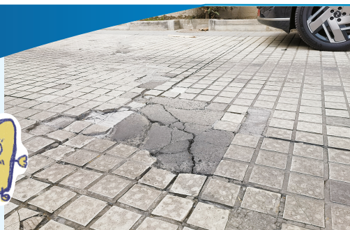
二号楼外地面局部塌陷碎裂