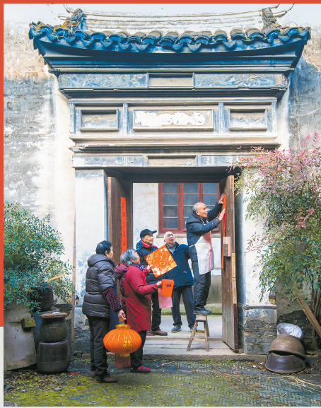
《春意浓浓——娄塘贴春联的汤家》