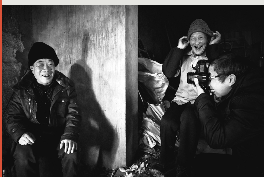
《最美瞬间》