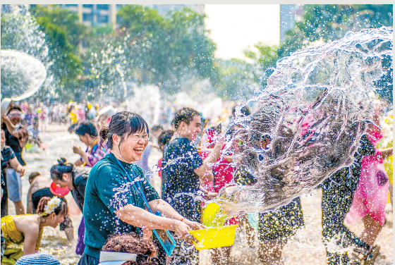
《欢乐泼水节》